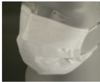
ノーズワイヤー付き