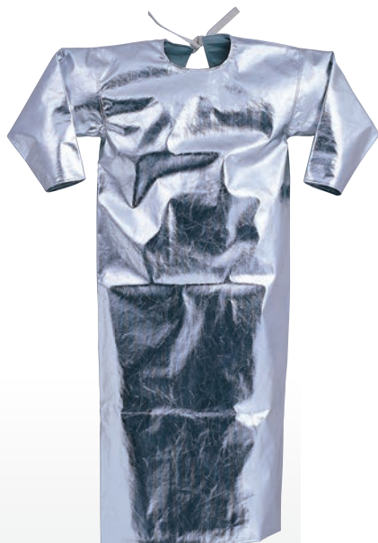
5040 アルミ袖つけ前掛