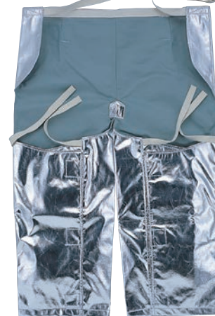
5011 アルミローハイド前掛