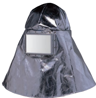
5030 アルミショートフード