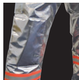
キルティング内蔵 膝パット