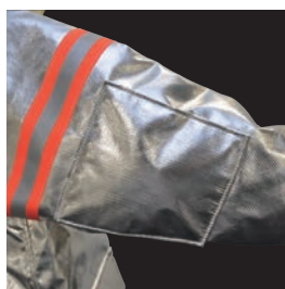
キルティング内蔵 肘パット