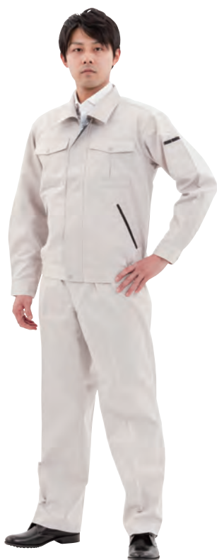
MG-WB02 (ブルゾン) MG-WP02 (パンツ)

縫製業務においては企画・製造にとどまらず、在庫管理・補修までをお受けできるよう、サプライチェーンを拡大し、一貫したサービス提供によって、お客様によりご満足いただける体制を展開予定です。